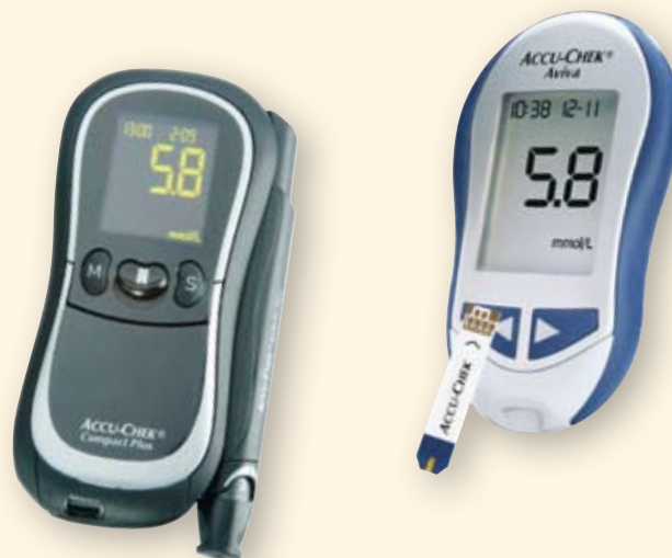
Accu-Chek Compact Plus